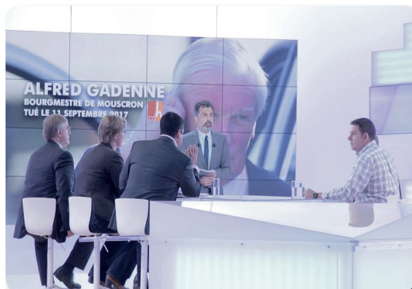
Débats sur la violence en politique