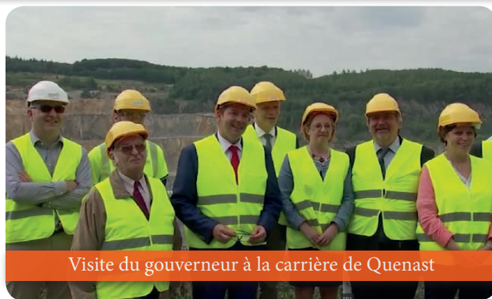
Visite du gouverneur à la carrière de Quenast