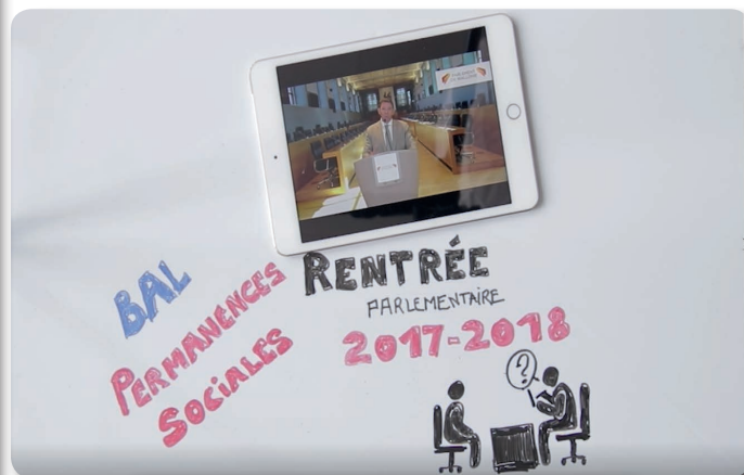
Cliquez pour voir ma vidéo de rentrée

Vous ne souhaitez plus recevoir cette newsletter ?