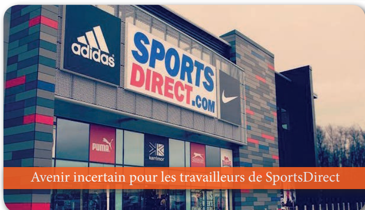
Avenir incertain pour les travailleurs de SportsDirect

Le sort incertain des employés de SportsDirect avec une fermeture pressentie pour plusieurs magasins. Des faillites annoncées au compte-goutte pour ne pas tomber sous le coup de la loi Renault. J'interpellerai le Ministre de l'Economie et de l'emploi lors de la prochaine commission pour voir ce qu'il compte faire pour aider ces travailleurs en désarroi.