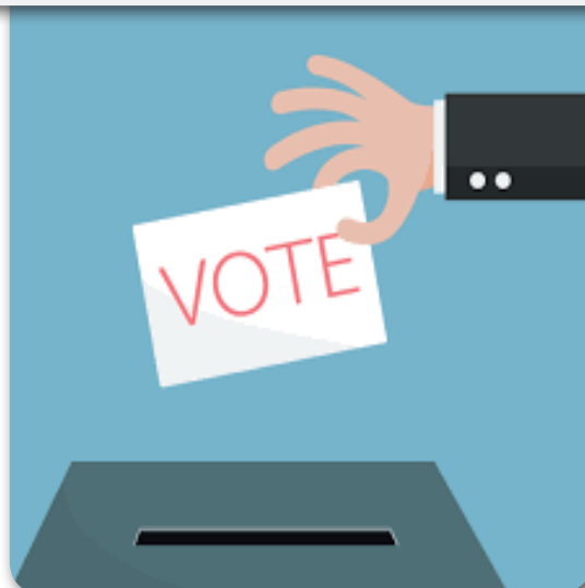
L'occasion de peser sur notre démocratie

Elections communales en 2018. Elections régionales, fédérales et européennes en 2019. Le climat politique s'anime et on peut dire que la campagne électorale est lancée. L'enjeu est de taille : l'avenir de notre société. Un moment de grande responsabilité pour chacun de nous.